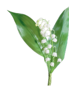
Un brin de muguet

En France, le premier mai, la tradition est d'offrir un brin de muguet aux personnes que l'on aime, pour leur porter bonheur. C'est la fête du muguet. Mais qu'est-ce que le muguet ? Quelles sont ses caractéristiques ?